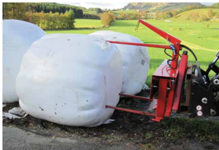
Modell 7850 besteht aus zwei untere Standardspeere und einen oberen. Darüber ist das Modell ganz oben mit einem weiteren hydraulischen Arm versehen. Dieser Arm schwenkt nach unten und hält die Folie bzw. das Netz zurück.

Die Maschine entfernt leicht und schnell die Folien und Netze der Rundballen. Ob Sie einen Mischwagen einsetzen, einen Fütterungswagen oder den Rundballen direkt auf die Futterablage legen – tks BaleStrip ist in jedem Fall ein nützlicher Assistent. Er schneidet den Ballen auf, wobei Folie und Netz am oberen Greifer hängen bleiben, um diese anschliessend separat ablegen zu können. Beim Mischwagen ist der Einsatz des tks BaleStrip besonders vorteilhaft, da man hier zum Entfernen der Folien bzw. Netze nicht mehr auf den Wagen klettern muss. Ausserdem wird der Inhalt des Ballens locker ausgebreitet, wodurch der anschliessende Mischvorgang im Wagen erleichtert wird.