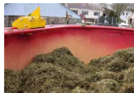
tkS BaleStrip wird zusammen mit einem stationären Messer verwendet. Das Messer kann entweder an einem Stativ auf dem Boden oder an der Seitenwand des Mischwagens montiert werden.