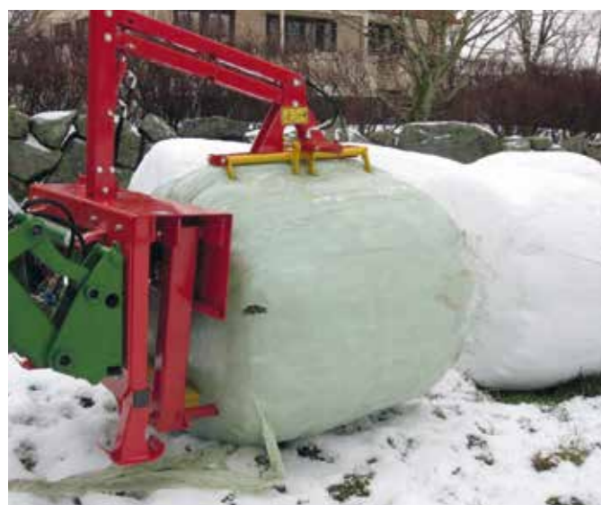
Modell 7860 ist mit einem hydraulischem Greifer ausgerüstet und ist für alle Ballengrössen verwendbar.