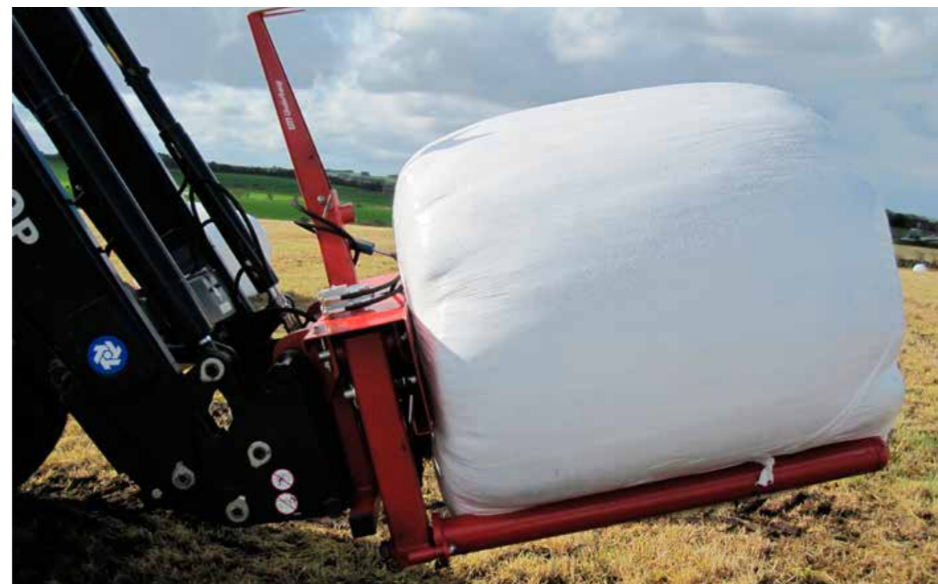
tkS BaleStrip kann auch als normaler Rundballengreifer benutzt werden. Zwei Rollen werden über die untere Standardspeere montiert. Schneller Umbau!