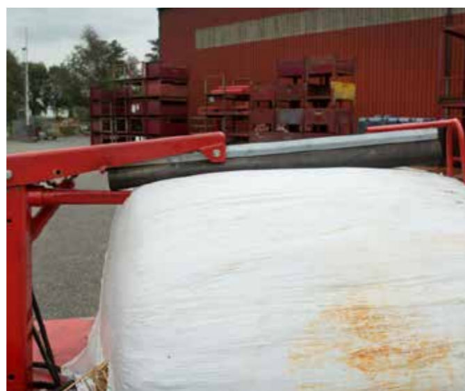
Modell 7870 ist ein Spezialmodell für Rundballen mit Garn. Das Garn wird automatisch abgeschnitten.